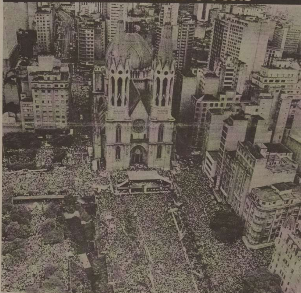
Comício pelas diretas - São Paulo 5/7/84