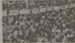
Comício Pré-Diretas - 26 de fevereiro - Divinópolis