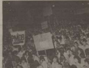
Comício Pré-Diretas - 17 de março - Montes Claros