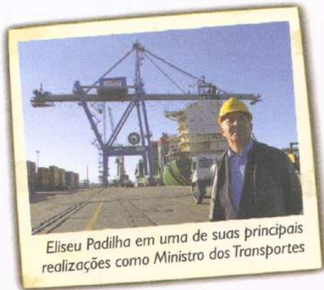
Eliseu Padilha em uma de suas principais realizações como Ministro dos Transportes

A conversão do Porto de Rio Grande em Porto do Mercosul garantiu à região uma revolução na economia – na indústria, no agenciamento naval, na qualificação profissional e nos salários – e vai garantir melhores índices de desenvolvimento à metade sul do Estado.