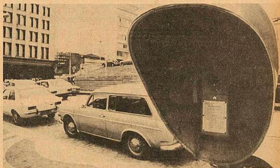
Cerca de 80% dos orelhões que a Telesc (ex-Cotesc) instalou na cidade foram destruídos pela ação do vandalismo. Estão mudos (Página 24)