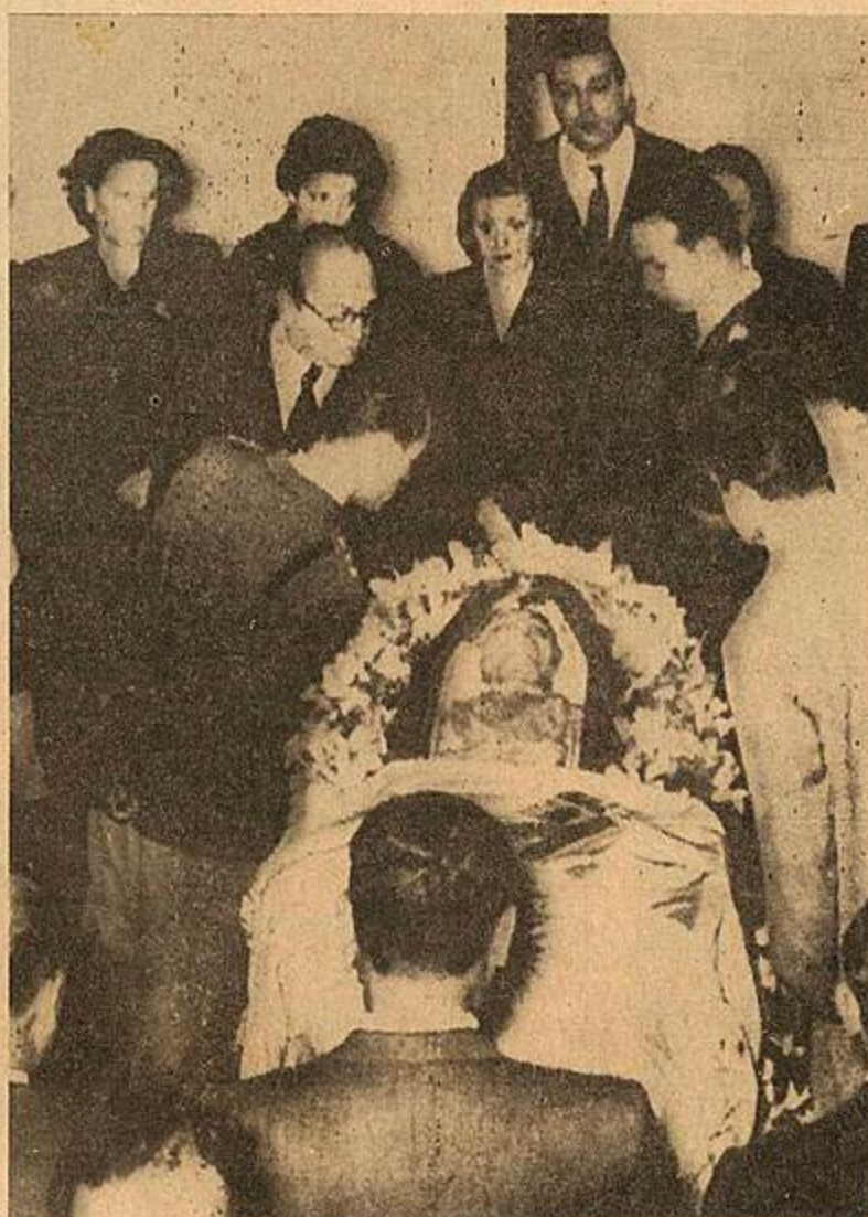
Em 27 de julho de 1952 Evita estava sendo velada. Dali o corpo foi para a Espanha (Página 6).